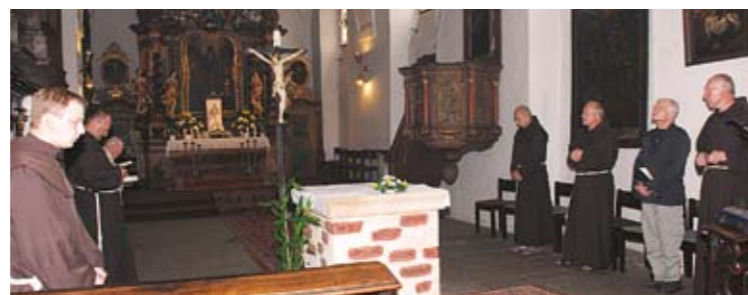
Gebetszeit am Mittag: Heute leben in der Prager Niederlassung des Ordens wieder 15 Brüder